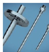
Schutzrohre & Zubehör