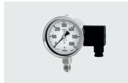
mit integriertem DMU, Typ DIGPTM