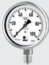
KPChg / KPChgG

Gehäuse / Ring Bördelringgehäuse CrNi-Stahl