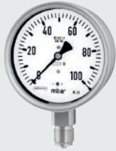
KPCh / KPChG

Gehäuse / Ring Bajonettingehäuse CrNi-Stahl