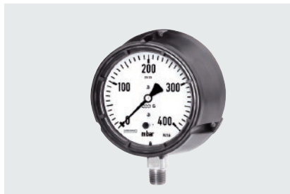
Process Gauge Gehäuse nach US-Standard