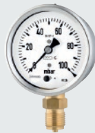
KPChg / KPChgG 80

Gehäuse / Ring Bördelringgehäuse CrNi-Stahl